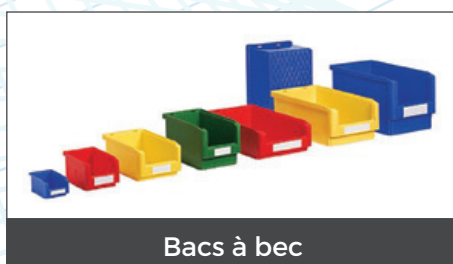
Bacs à bec