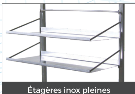
Étagères inox pleines