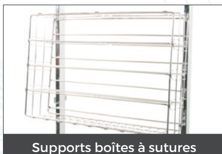
Supports boîtes à sutures